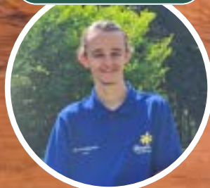
Unser vielseitiger Rezeptionist