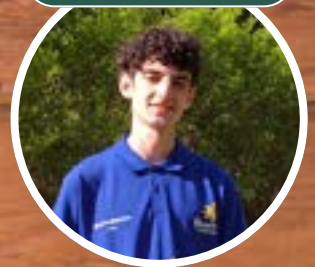
Unser vielseitiger Rezeptionist