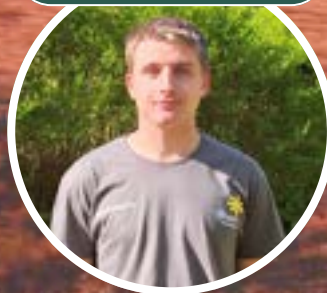
Unser Landschaftsgestalter in der Ausbildung